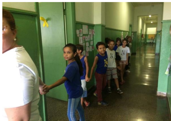
Fila de saída da sala ao ponto de encontro.

Organiza o fluxo de alunos nos corredores das salas de aula. Deve ficar atento para liberar uma turma de cada vez, de modo a não haver filas duplas. Ao encerrar a saída de seu andar ou bloco, deverá conferir se todas as salas estão vazias e marcadas com um traço na diagonal, só então deve se deslocar até o Ponto de Encontro. Nos pontos de conflito (cruzamentos, escadas e etc.), orienta as filas que devem avançar de acordo com a prioridade da emergência, não permitindo cruzamentos das filas nem correria. Importante não esquecer de verificar os banheiros. Concluída a verificação em todo o bloco ou andar, segue atrás da fila de alunos para o Ponto de Encontro.