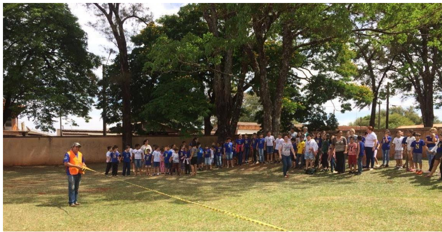
Local de encontro. (simulado executado)

Local previamente estabelecido, onde serão reunidos todos os alunos, professores, funcionários e outras pessoas que estejam em visita à escola. Neste local as faltas de alunos constatadas pelos professores ou a ausência de funcionários deverão ser comunicadas o mais breve possível ao responsável pelo Ponto de Encontro. Ele por sua vez deve repassar as informações ao chefe de equipe de emergência para que as devidas providências sejam tomadas.