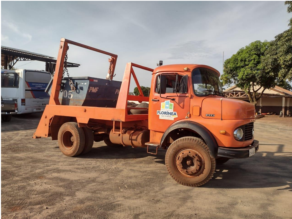
Figura 7- Caminhão polinguindaste da Prefeitura Municipal de Florínea