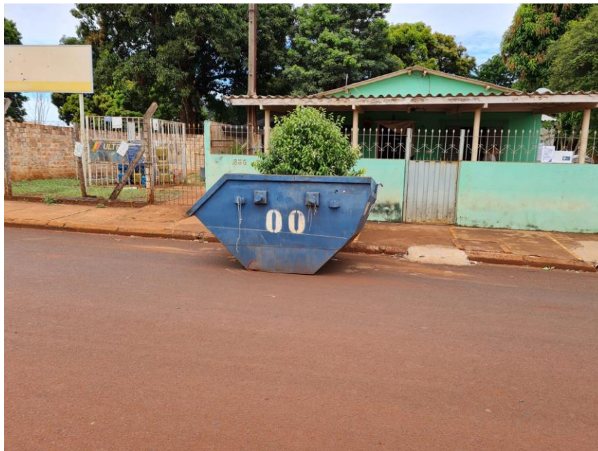
Figura 5- Caçambas da prefeitura