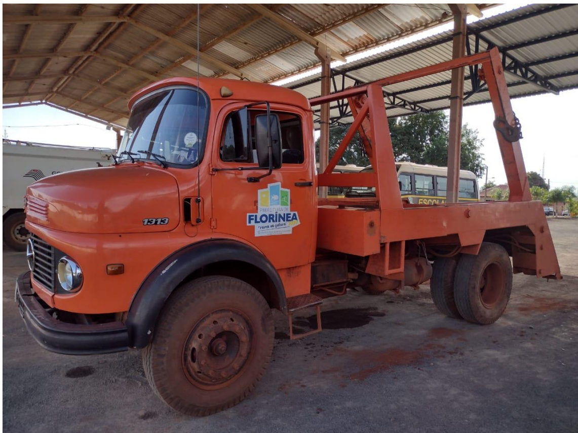
Figura 6- Caminhão polinguindaste da Prefeitura Municipal de Florínea

O município disponibiliza de 13 caçambas para o acondicionamento e um caminhão poli guindaste utilizado para o transporte. A caçamba pode ser requerida na Garagem Municipal, de segunda a sexta-feira, no horário de expediente.