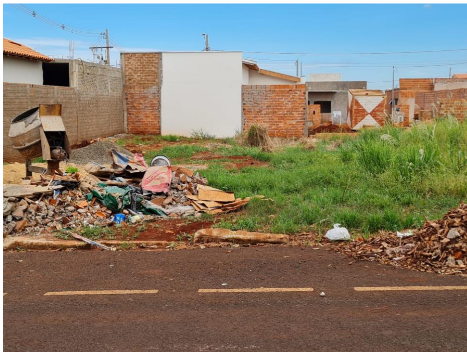
Figura 3- Resíduos de construção descartados de forma irregular