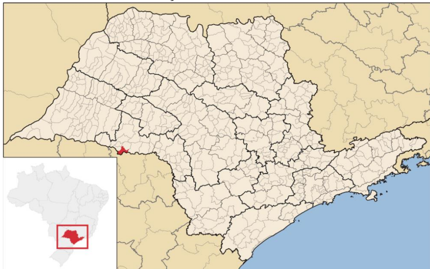
FIGURA 1- LOCALIZAÇÃO DO MUNICÍPIO DE FLORÍNEA-SP