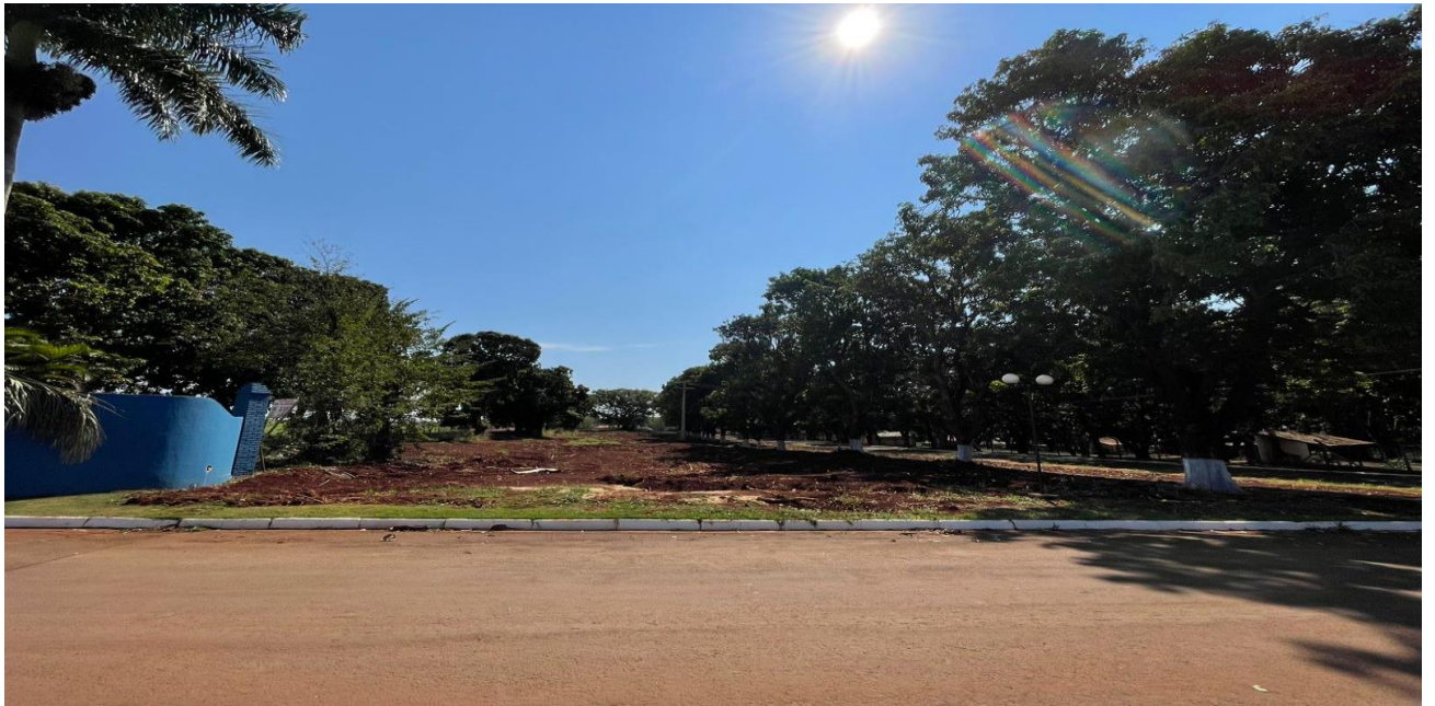
Figura 1 - Visão lateral - sentido estrada municipal para o recanto das águas

Visão lateral – sentido estrada municipal para recanto das águas.